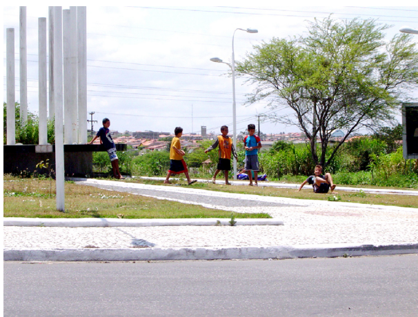
Imagem 05: Crianças brincando no giradouro

Outro espaço identificado, no bairro, e bastante utilizado pelos moradores, mesmo diante de sua precária conservação, é o Centro de Atenção Integral à Criança, o CAIC, que apresenta uma estrutura considerável contemplando um ginásio poliesportivo, uma quadra de areia e um espaço utilizado como pista de skate. O CAIC é um espaço utilizado para realizações de eventos do bairro como copas de futsal, movimentos religiosos e manifestações de cunho público, como palestras educativas e prestações de serviços promovidos pelo poder público.